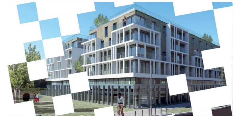
DAME SQUARE, au Val d'Europe Rue d'Amsterdam, 77144 Montévrain